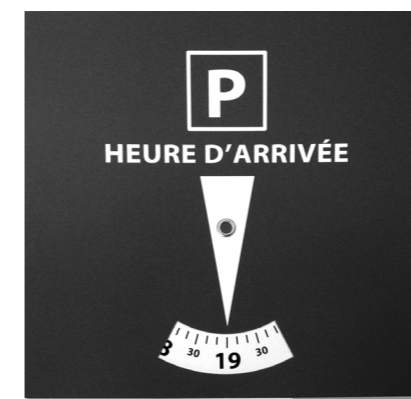
NOUVEAU DISQUE DE STATIONNEMENT.

Petite information passée inaperçue, mais qui nous a été signalée par un Villettois avisé: les disques de stationnement « Zone Bleue », que vous pouvez rencontrer lors de vos déplacements (Septeuil, Mantes, etc.) ont changé, et un nouveau modèle est désormais en vigueur, qui n'indique plus que l'heure d'arrivée. Le temps de stationnement autorisé peut ainsi varier selon les zones, mais en absence d'information, le standard est de 1h30 de stationnement. On commence à trouver ce nouveau disque dans les magasins; pensez à en faire l'achat, car l'utilisation de l'ancien modèle peut donner lieu à contravention (17 €).